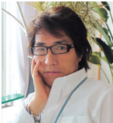
デザインディレクター